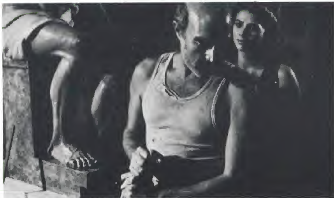
Emiliano Redondo - Victoria Abril